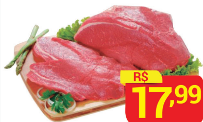
Coxão Duro Bife Kg