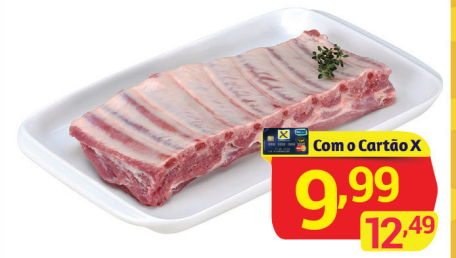
Costelinha Congelada Suína Kg