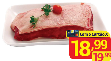
Contrafilé Peça à Vácuo Kg