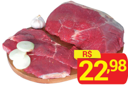
Alcatra Bife Kg