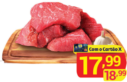
Alcatra C/ Maminha Peça à Vácuo Kg