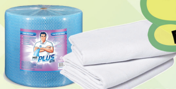
PANOS E SACOS ALVEJADOS