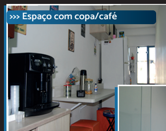
>>> Espaço com copa/café

Na prática, nos dois primeiros meses, você irá pagar apenas R$ 249,50 na posição individual e R$ 749,50 na sala de 6 posições.