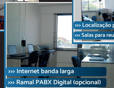
>>> Internet banda larga >>> Ramal PABX Digital (opcional)