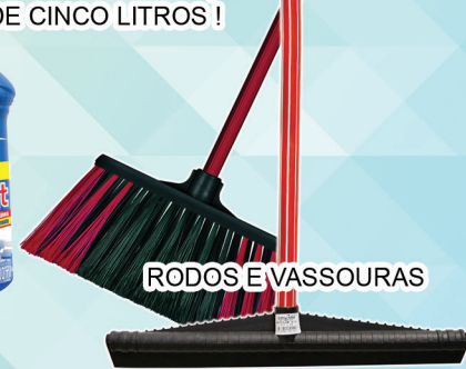
RODOS E VASSOURAS