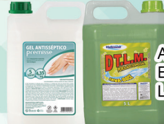
ALCOOL GEL E SABONETE LÍQUIDO