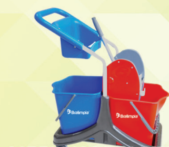
CARRINHOS DE LIMPEZA