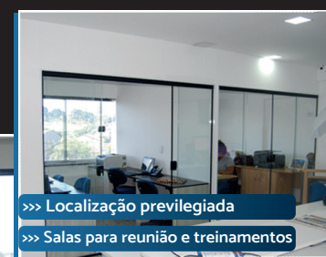
>>> Localização privilegiada >>> Salas para reunião e treinamentos