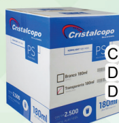
COPOS DESCARTÁVEIS DE ATÉ 300ML