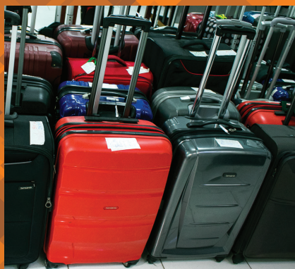
Conserto de malas de fibra e tecido