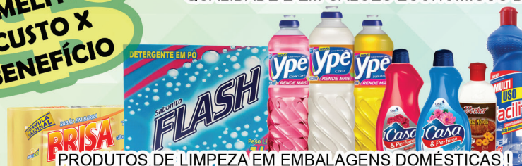
PRODUTOS DE LIMPEZA EM EMBALAGENS DOMÉSTICAS!