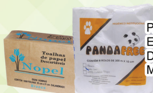
PAPEL TOALHA E HIGIÊNICO DE VÁRIOS MODELOS