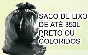
SACO DE LIXO DE ATÉ 350L PRETO OU COLORIDOS