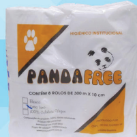
PAPEL HIGIÊNICO E TOALHA INSTITUCIONAL