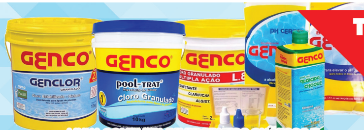
LINHA COMPLETA DE PRODUTOS QUÍMICOS E ACESSÓRIOS PARA PISCINAS COM PREÇOS INCRÍVEIS!

TREINAMENTO GRÁTIS P/ TRATADORES DE PISCINAS!