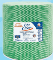
PAÑO MULTIUSO PARA LIMPEZA