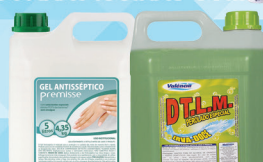
ALCOOL GEL E SABONETE LÍQUIDO