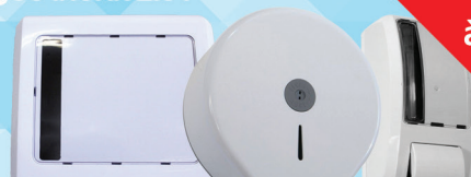
SUPORTES PARA PAPEL, SABONETEIRAS, E TODA LINHA DE DISPENSERS