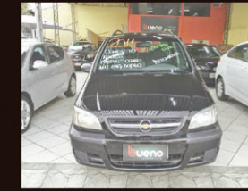
Zafira Elite 2.0 flex Automático 2011 Completo