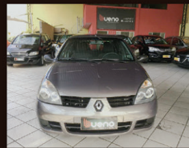
Clio Expression 1.0 Flex Completo