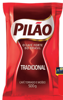
Café Pilão Tradicional 500g