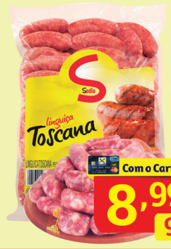
Linguiça Toscana Sadia Kg

Ofertas válidas para Segunda e Terça dias 15/10 e 16/10/2018