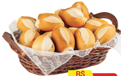
Pão Francês kg