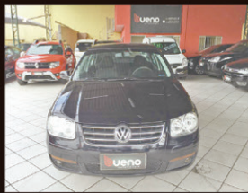
Bora 2.0 Flex 2011 Completo