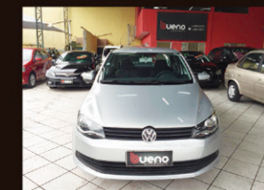
Voyage G6 1.0 Flex 2015 Completo