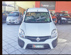
Kangoo expression 1.6 Flex 2015 Direção Hidráulica/ Ar Condicionado