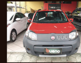
Uno Way 1.0 Flex 2014 Completo - Ar Condicionado