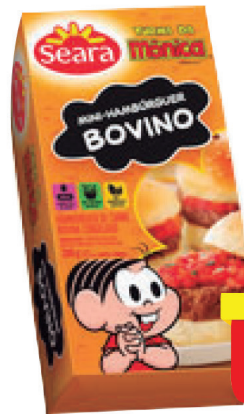
Hambúrguer Congelado Turma da Mônica Sabores 200g