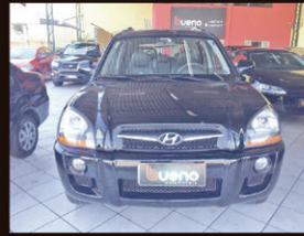
Tucson GLS 2.0 Automático 2012 Completo