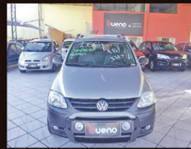
Crossfox 1.6 Flex 2006 Completo