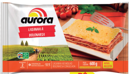
Lasanha Congelada Aurora Sabores 600g