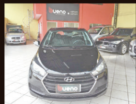
Hb20 comfort plus 1.6 Flex 2017 Completo