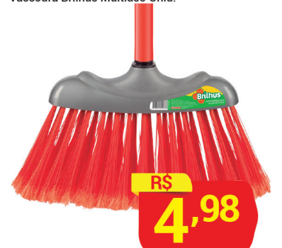
Vassoura Brilhus Multiuso Unid.