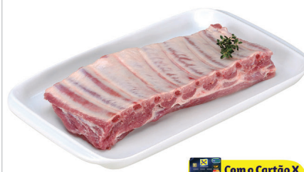
Costela Congelada Suína Kg