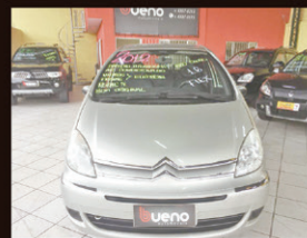
Picasso Glx 1.6 2012 Completo