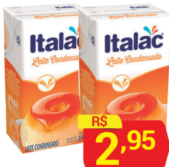
Leite Condensado Italac Tradicional TP 395g