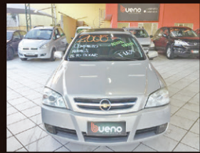
Astra elegante 2.0 Flex 2005 Completo + Teto Solar