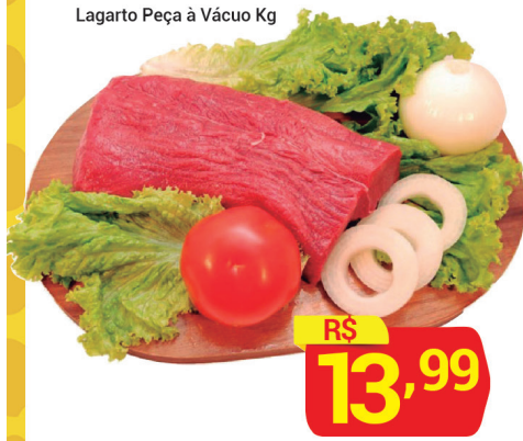
Lagarto Peça à Vácuo Kg

Ofertas válida para as lojas do Bom Clima e Mikail, para Sábado a Terça, dias 13/10 a 16/10/2018 ou enquanto durarem os estoques, dentro da data anunciada.