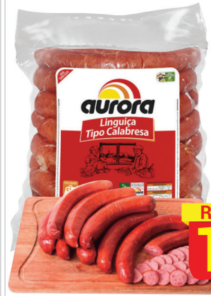
Linguiça Calabresa Aurora Kg