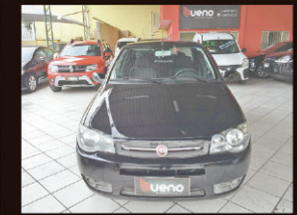
Siena Celebration 2011 Completo 1.0 Flex - Ar Condicionado