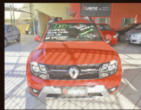
Duster Dynamique 1.6 flex 2016 completo