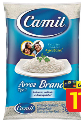
Arroz Camil TP 1 5Kg