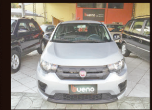
Mobi easy one 1.0 Flex 2017 Direção Hidráulica e Ar Condicionado