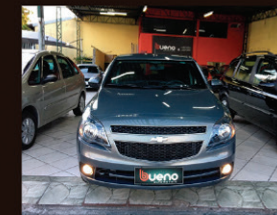
Agile LTZ 1.4 Flex 2013 Completo só 10.000km