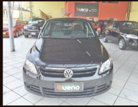
Gol trend 1.0 Flex 2009 Completo