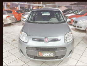
Palio Attractive 1.0 Flex 2015 Completo