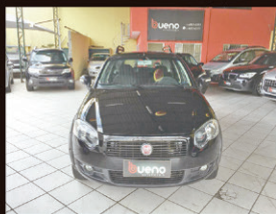
Palio Weekend 2011 Trekking 1.6 Flex Completo