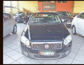
Siena ELX 1.4 Flex 2009 Completo