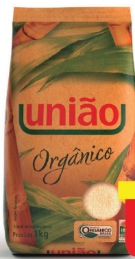
Açúcar União Cristal Orgânico 1Kg