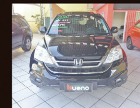
CRV EXL 2.0 2010 Automático Completo