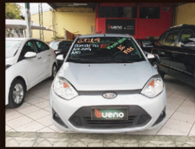
Fiesta Hatch 1.6 Flex 2014 Completo