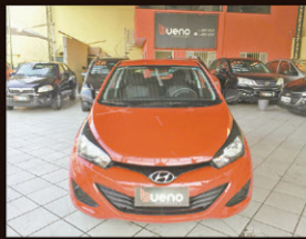
Hb20 Comfort 1.0 Flex 2015