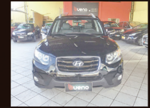
Santa Fe GLS 3.5 2011 Completo