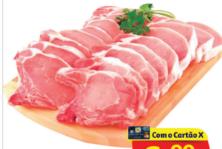
Bisteca Congelada Suína Kg