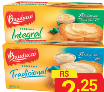
Torrada Bauducco Tipos 160g