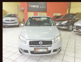
Palio elx 1.4 Flex 2008 Direção Hidráulica