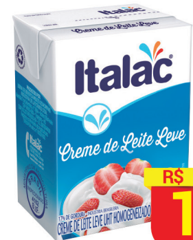
Crema de Leite Italac Leve Tradicional 200ml