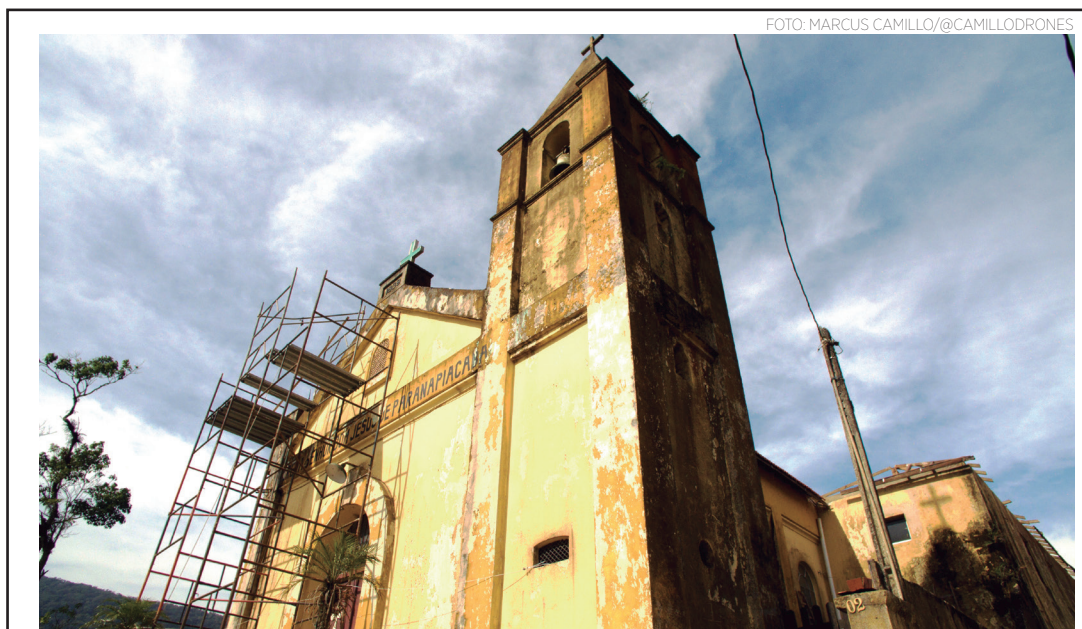
TURISMO - Igrejas em Paranapiacaba ajudam a contar a história da construção de São Paulo