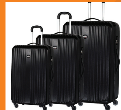
Venda e aluguel de malas de viagem com o melhor preço do mercado

Somos a maior empresa do Brasil em conserto, venda e aluguel de malas de viagem. Entre em contato conosco e peça um orçamento, sem compromisso.