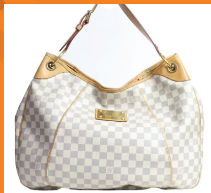
Reparos diversos em bolsas femininas