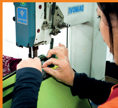
Troca de zíper e costura