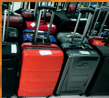
Conserto de malas de fibra e tecido