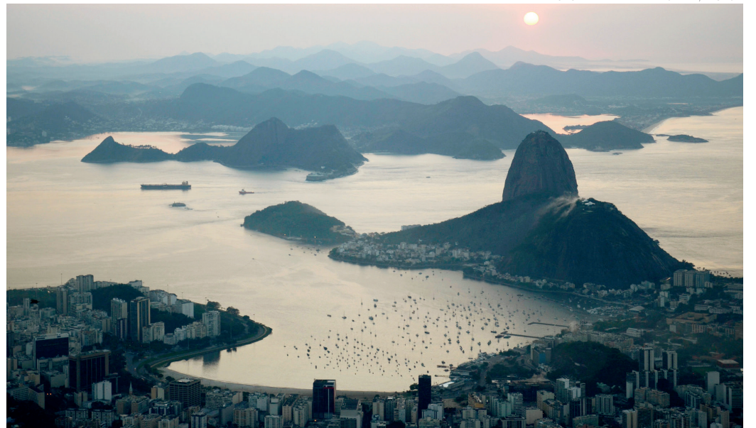
TURISMO - Vista aérea de um fim de tarde da cidade do Rio de Janeiro com suas belezas naturais