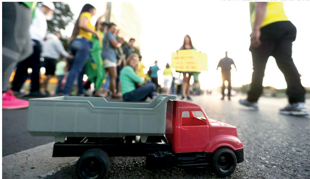
MANIFESTAÇÃO - Motoristas de guincho protestam na Praça dos Três Poderes, em Brasília