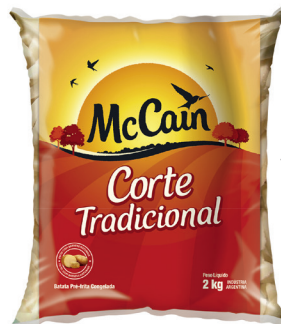
Batata tradicional Mccain congelada 2 kg