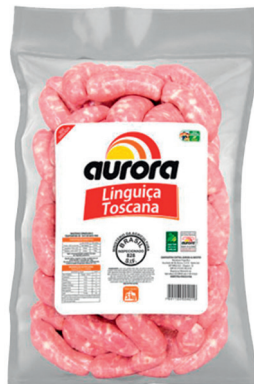
Linguiça toscana Aurora pacote 5 kg