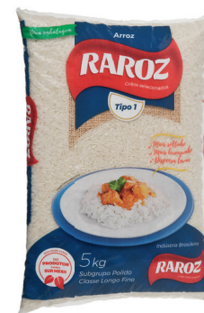
Arroz Raroz branco tipo 1 pacote 5 kg