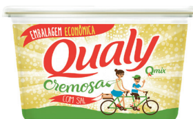
Margarina com sal Qualy 1 kg