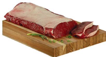
Contrafilé bovino peça inteira a vácuo kg