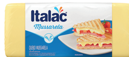
Queijo mussarela Italac peça kg