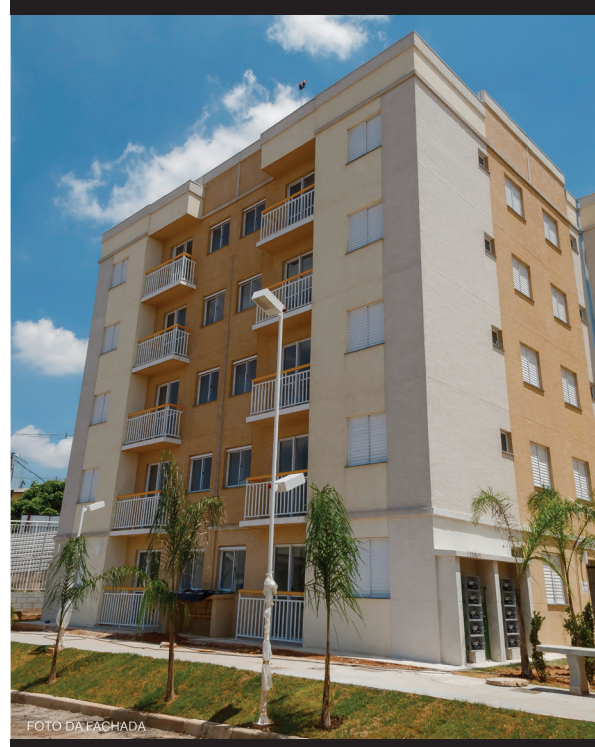
FOTO DA FACHADA