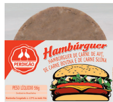
Hambúrguer misto Perdigão c/ 56 g