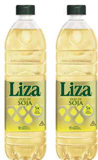
Óleo de soja Liza pet 900 ml

Ofertas válidas somente para o dia 07/04, enquanto durarem os estoques.