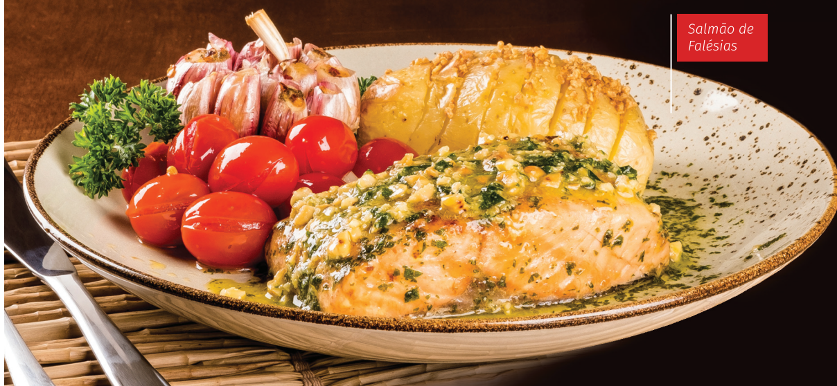
Salmão de Falésias

Esse e outros 2 pratos ficam no nosso cardápio do dia 22/03 até 06/04. Não deixe de experimentar!