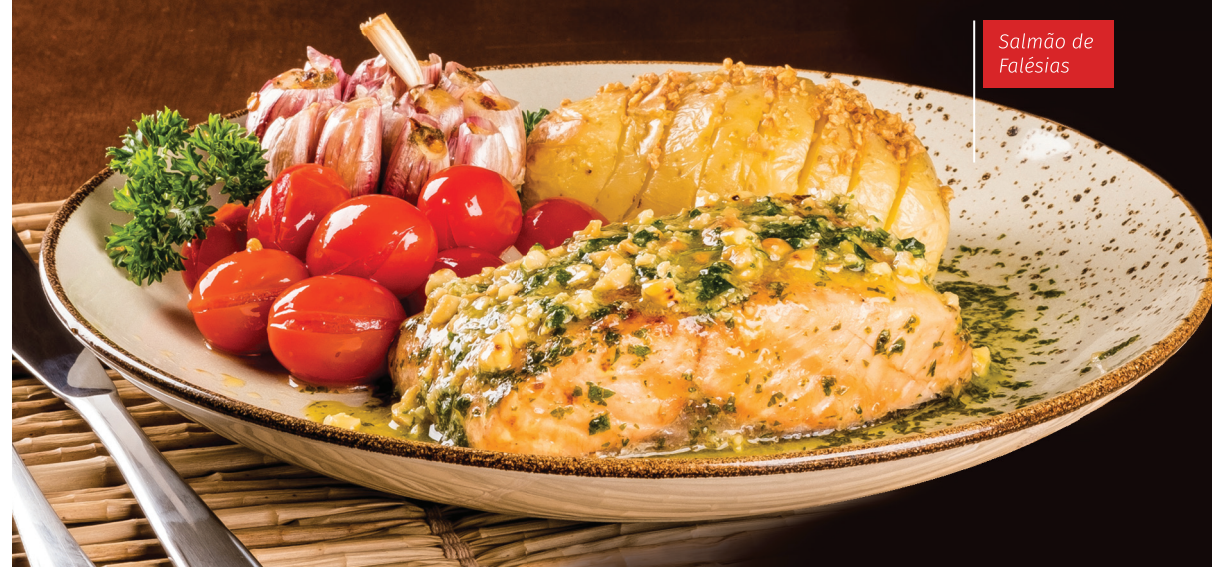
Salmão de Falésias

Esse e outros 2 pratos ficam no nosso cardápio do dia 22/03 até 06/04. Não deixe de experimentar!