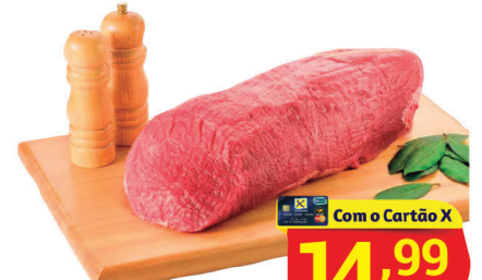
Lagarto Peça à Vácuo Kg