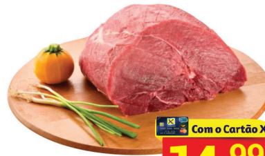
Patinho Peça à Vácuo Kg