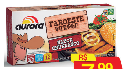
Hambúrguer Faroeste Aurora Sabores 672g