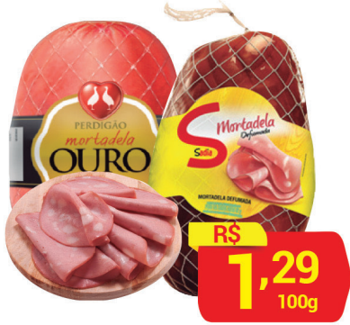
Mortadela Ouro/ Sadia Defumada 100g