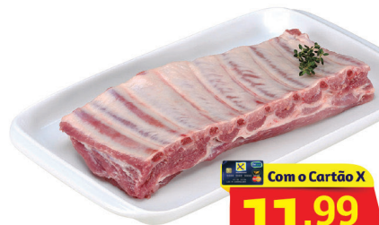
Costelinha Suína Kg