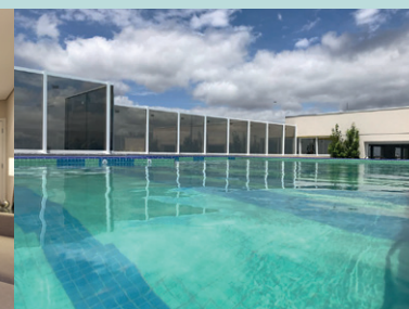
Foto da piscina