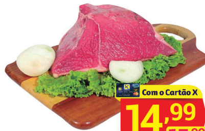
Coxão Duro Peça à Vácuo Kg