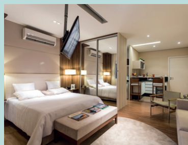
Foto do studio de 37 m 2

SALAS COMERCIAIS 31, 37 OU 49 M 2 - 1 VAGA