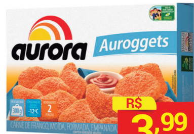
Auroggets Aurora 300g