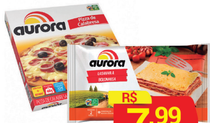
Lasanha Congelada Aurora Sabores 600g/ Pizza Congelada Aurora Sabores 460g