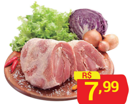
Pernil Congelado c/ Osso Nobre Peça/ Peça/ Fatiado Kg