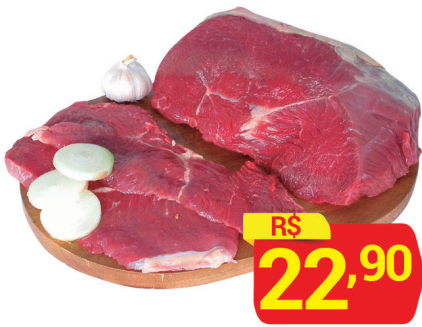
Alcatra Peça à vácuo Kg

Jornal válido para todas as lojas. Com válida para Sábado a Terça , dias 12/01 a 15/01/2019 ou enquanto durarem os estoques, dentro da data anunciada